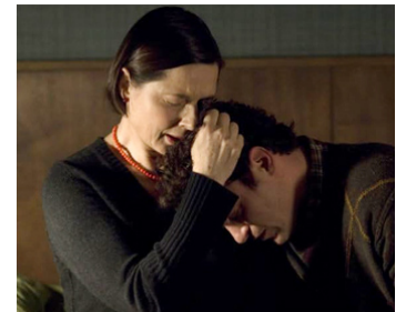
2008 TWO LOVERS (Two Lovers) de James Gray avec Joaquin Phoenix