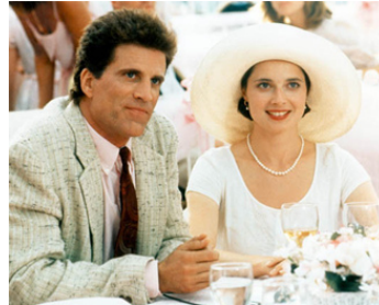
1989 COUSINS (A Touch of Infidelity) de Joel Schumacher avec Ted Danson