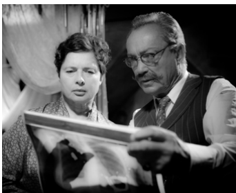
2012 ULYSSE, SOUVIENS-TOI (Keyhole) de Guy Maddin avec Udo Kier