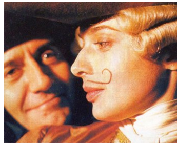
1991 LE DIABLE À QUATRE (Caccia alla vedova) de Giorgio Ferrara avec Tom Conti