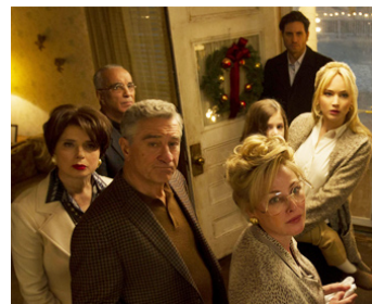
2015 JOY (Joy) de David O. Russell avec Robert De Niro, Virginia Madsen, Jennifer Lawrence