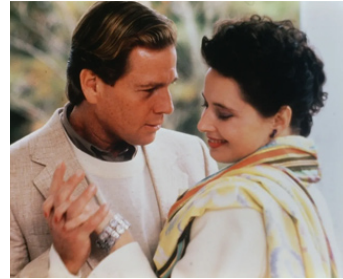
1987 LES VRAIS DURS NE DANSENT PAS (Tough Guys don't dance) de N. Mailer avec R. O'Neal