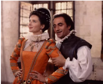
1990 DAMES GALANTES de Jean-Charles Tacchella avec Richard Bohringer