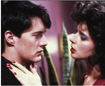
1986 BLUE VELVET (Blue Velvet) de David Lynch avec Kyle MacLachlan