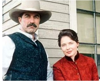
2003 MONTE WALSH (Monte Walsh) de Simon Wincer avec Tom Selleck