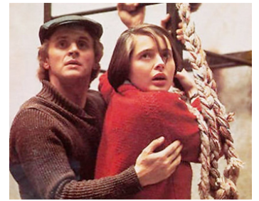
1985 SOLEIL DE NUIT (White Nights) de Taylor Hackford avec Mikhail Baryshnikov