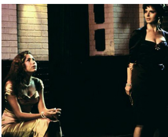
1996 BIG NIGHT (Big Night) de Campbell Scott & Stanley Tucci avec Minnie Driver