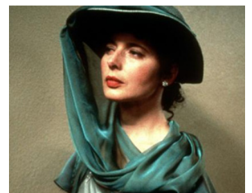
1998 LES IMPOSTEURS (The Impostors) de Stanley Tucci