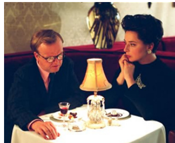
2006 SCANDALEUSEMENT CÉLÈBRE (Infamous) de Douglas McGrath avec Toby Jones