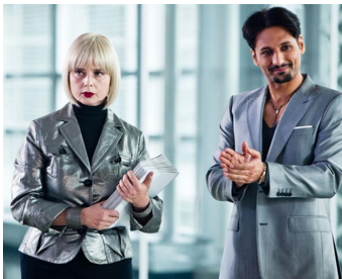
2009 PHANTOM, LE MASQUE DE L'OMBRE (Phantom) de Paolo Barzman avec Cas Anvar