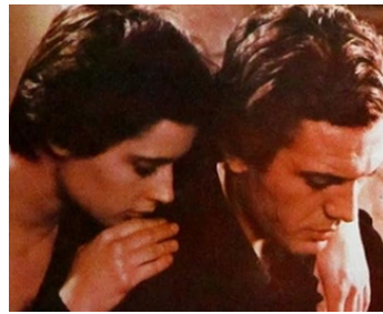
1979 LE PRÉ (Il prato) de Paolo et Vittorio Taviani avec Saverio Marconi