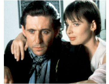
1987 SIESTA (Siesta) de Mary Lambert avec Gabriel Byrne