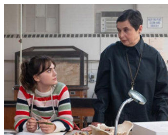
2023 CAT PERSON (Cat Person) de Susanna Fogel avec Emilia Jones