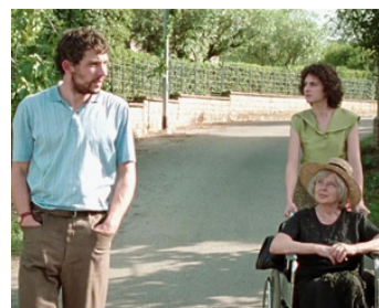
2023 LA CHIMÈRE (La chimera) d'Alice Rohrwacher avec John O'Connor, Carol Duarte