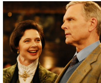
2008 UN MARI DE TROP (The Accidental Husband) de Griffin Dunn avec Keir Dullea