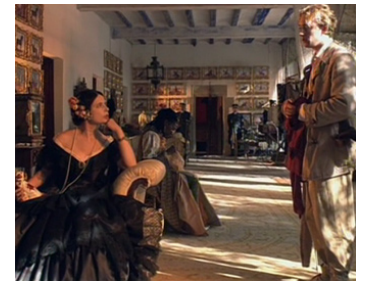
2003 THE TULSE LUPER SUITCASES de Peter Greenaway avec J. J. Feild