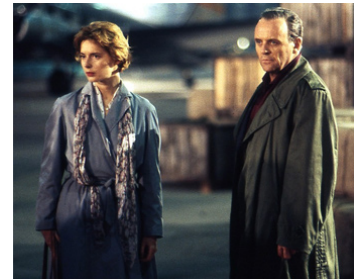
1993 L'INNOCENT (The Innocent) de John Schlesinger avec Anthony Hopkins