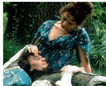
1994 LUDWIG VAN B. (Immortal Beloved) de Bernard Rose avec Gary Oldman