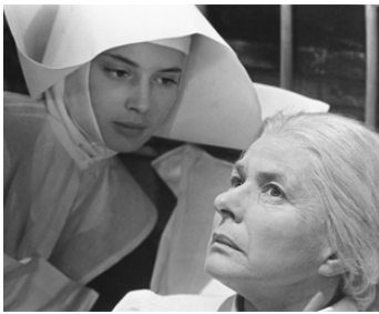
1976 NINA (A Matter of Time) de Vincente Minnelli avec Ingrid Bergman