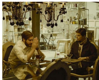
2013 ENEMY (Enemy) de Denis Villeneuve avec Jake Gyllenhaal