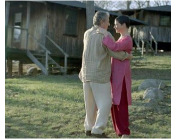
2004 KING OF THE CORNER (King of the Corner) de et avec Peter Riegert