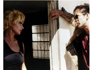
1990 SAILOR ET LULA (Wild at Heart) de David Lynch avec Nicolas Cage