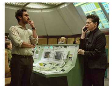
2024 SPACEMAN (Spaceman) de Johan Renck avec Kunal Nayyar