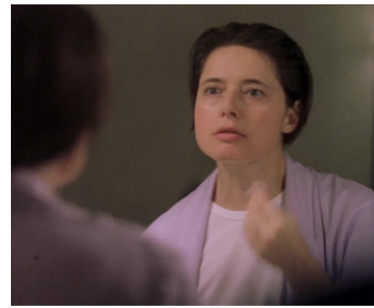
2002 ROGER DODGER (Roger Dodger) de Dylan Kidd