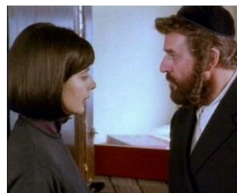
1998 À LA RECHERCHE DU PASSÉ (Left Luggage) de Jeroen Krabbé avec Topol