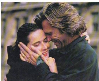
1993 ÉTAT SECOND (Fearless) de Peter Weir avec Jeff Bridges