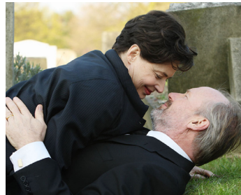
2011 TROIS FOIS VINGT ANS de Julie Gavras avec William Hurt