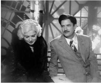
2003 THE SADDEST MUSIC IN THE WORLD de Guy Maddin avec Mark McKinney