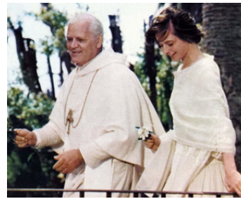
1980 IL PAP'OCCHIO de Renzo Arbore avec Anthony Hopkins