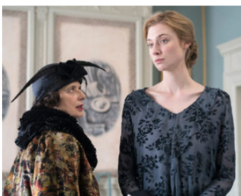
2018 VITA & VIRGINIA (Vita and Virginia) de Chanya Button avec Elizabeth Debicki