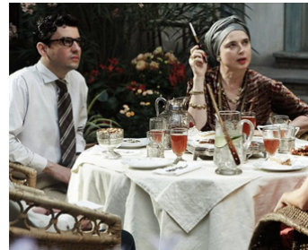
2011 POULET AUX PRUNES de Marjane Satrapi & Vincent Paronnaud avec Éric Caravaca