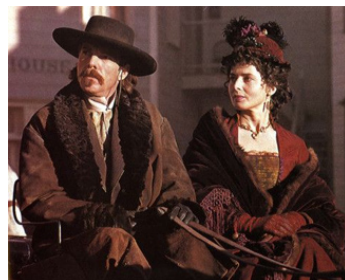
1994 WYATT EARP (Wyat Earp) de Lawrence Kasdan avec Dennis Quaid