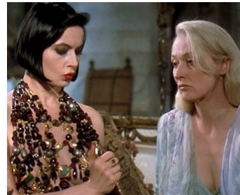
1992 LA MORT VOUS VA SI BIEN (Death becomes her) de Robert Zemeckis avec Meryl Streep