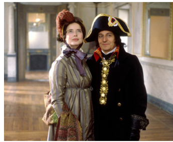
2002 NAPOLÉON d'Yves Simoneau avec Christian Clavier