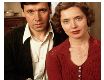
1996 LE CRIME DU SIÈCLE (Crime of the Century) de Mark Rydell avec Stephen Rea